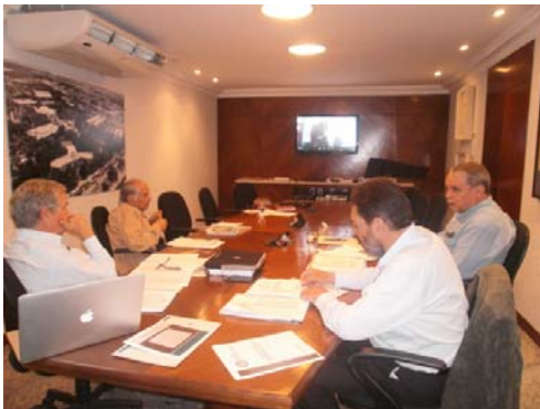
Reunión de trabajo del Comité Dictaminador

La Universidad Latina de Panamá alcanzó el status de Universidad Acreditada con Observaciones.